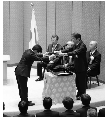
日本学術振興会賞授賞式の様子