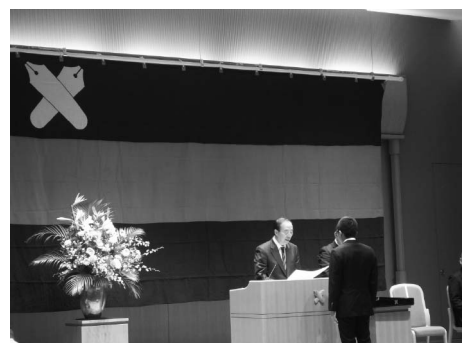
平成 28 年度義塾賞授賞式の様子 (平成 28 年 11 月 11 日)